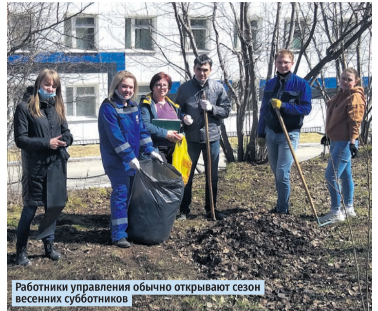
Работники управления обычно открывают сезон весенних субботников