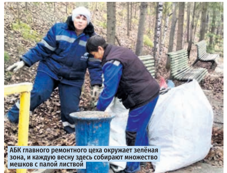
АБК главного ремонтного цеха окружает зелёная зона, и каждую весну здесь собирают множество мешков с палой листвой